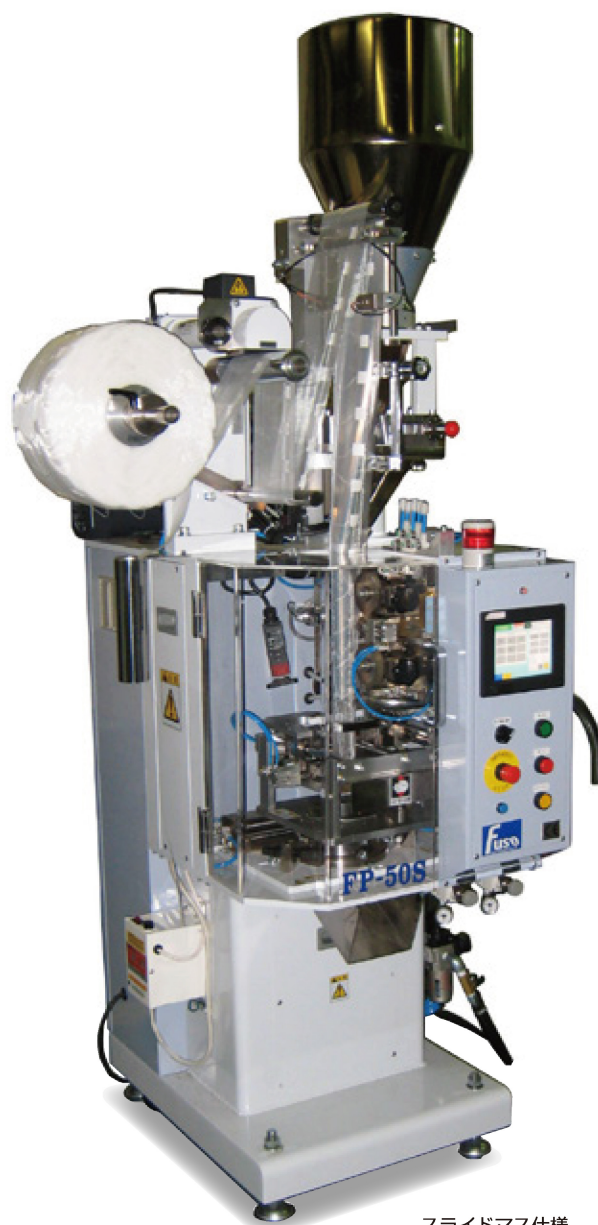
スライドマス仕様